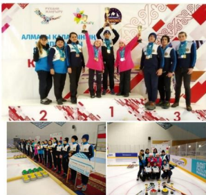
Кубок и Чемпионат РК по керлингу 8.11.2018 год. Алматы